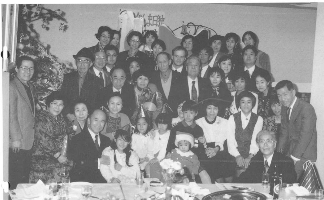
・ぐんま日独協会クリスマスの集い

〒371 前橋市三俣町3-11-12 ☎ 0272-31-7212 FAX 0272-32-4082