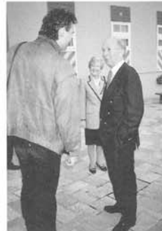
① 赤城クローネンベルグドイツ村でハース大使とマイスターハースが、ハース対談(1994, 4, 16)