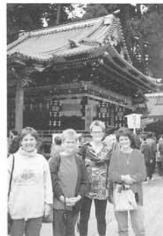
③ 室内楽団 Altusriedes Hausmusik の皆さんを日光へご案内。