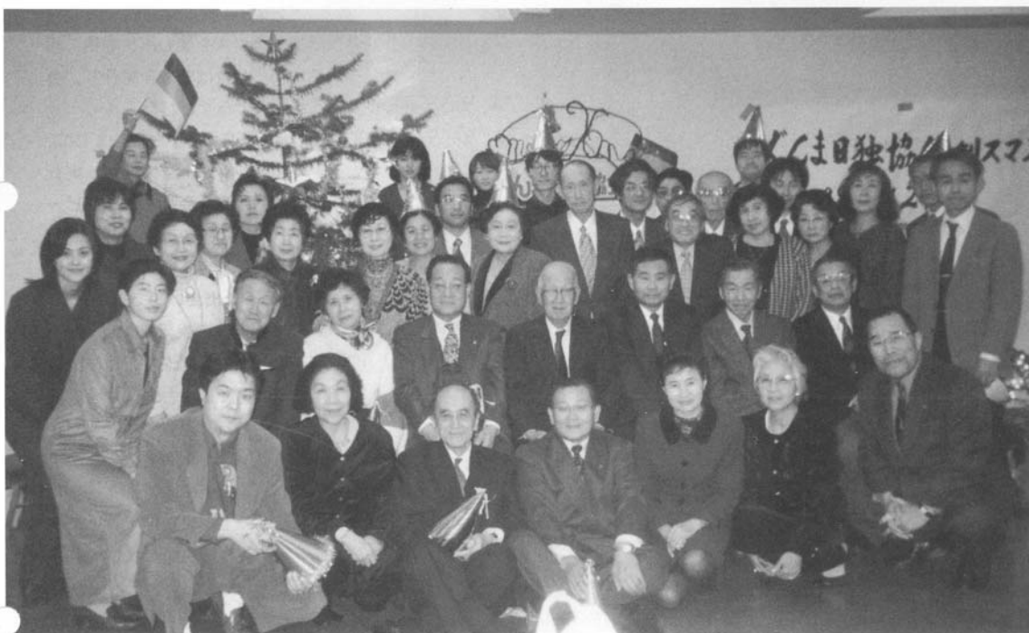
ぐんま日独協会クリスマスの集い