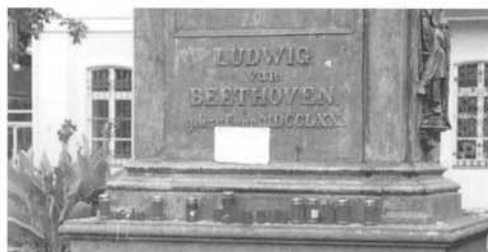
ボンミュンスター広場のベートーヴェン像の下にはテロの犠牲者を悼むローソクが捧げられていた。