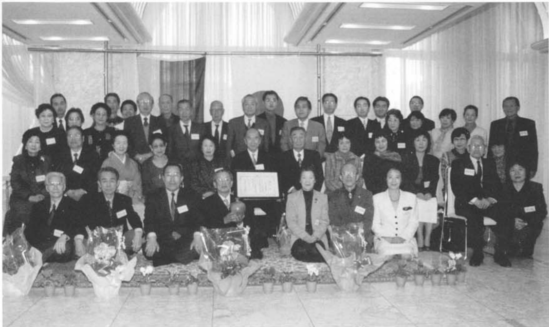
2001.12.8 クリスマス 於：群馬会館大理石の間