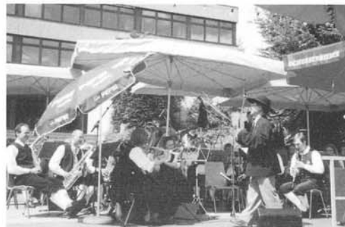
臨時客員指揮者(著者)によるシュッセンリーダー楽団の演奏

OCHSENHAUSEN - Die Aktionäre der Öchsle-AG treffen sich heute, 15 Uhr, in der Kapfhalle Ochsenhausen zur Hauptversammlung. Auf der Tagesordnung stehen neben den jährlichen Planungen vor allem das neue Gesamtbetriebskonzept für die Museumsbahn, das millionenschwere Investitionen in die Bahnstrecke durch die Öchsle-AG vorsieht. Zudem soll eine Dampflok gekauft werden. Zur Veranstaltung werden Gäste aus aller Welt erwartet, so auch der japanische Aktionär Prof. Takuo Shirakura aus Takasaki nebst Frau.