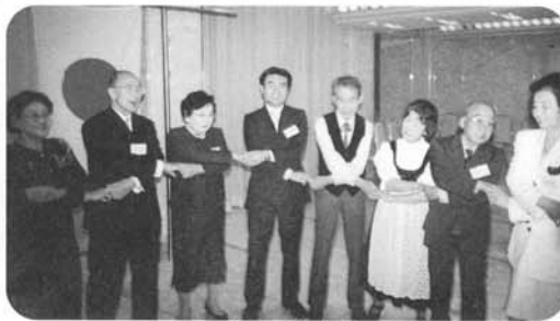
フィナーレは“ムシデン”