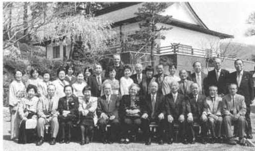
(f3) 教正眞教にて観桜