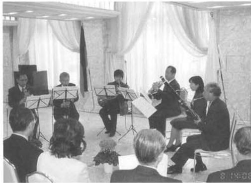
◇素晴らしい音楽をきかせてくれた、ベルジュラック合奏団の人びと。