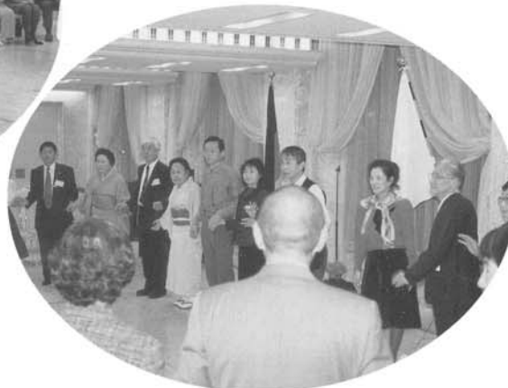
◇輪になって踊ろうよ、フォークダンス