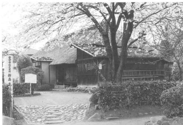
安中市指定史跡 新島家旧邸