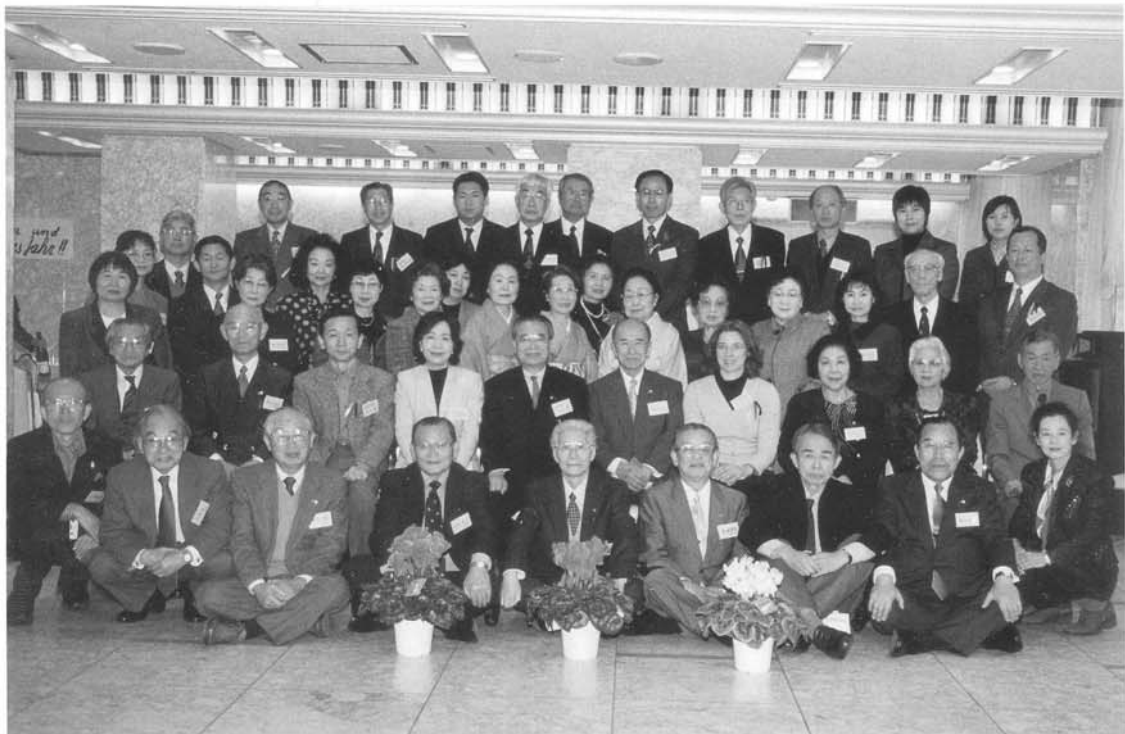
アンサンブル・ベルジュラックを迎えてのX'mas (2002年12月8日・群馬会館大理石の間)

〒377-0007 渋川市石原966 母心堂 平形眼科方 ☎ 0279-22-0149 FAX 0279-24-6867