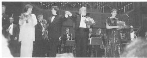
アルテオーバの演奏会(フランクフルト)

翌日は周辺の都市を尋ねることにした。ヴィースバーデンは40km西の保養地で温泉が出るので有名な街である。マインツはその南10kmにある街でライン下りの出発点でもある。マンハイムは更に南50kmの古都であり、18世紀には可成りの権勢を誇っていたと云う。今年の春前橋商業の吹奏楽団が招待された街でもある。此所から北へ上り、フランクフルトに近づくとダルムシュタットがある。これらの街を忙しく一巡りして戻ると夜になった。翌日はケルンに行く。多分何か音楽があるだろうと思ったが生憎この日は空振りであった。望みを南隣のボンに託した所、此所のオペラハウスでロッシーニの「セビラの理髮師」を上演していた。劇場の近くのホテルへ泊まることにしたが、何とその名前は「ペートーヴェン」である。因みにその生家は街の中心にあり観光客で賑わっている。