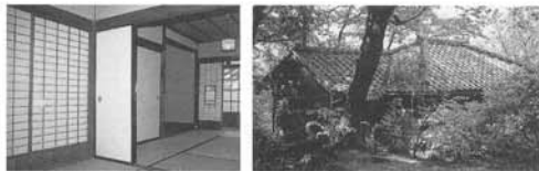
少林寺山達磨寺境内のブルーノ・タウト洗心亭の内部と外観

このような群馬にちなむ日独交流の跡を訪ね、温故知新の心をもって、日独親善を末永く発展継続させるのも、私たち群馬の使命と存じます。