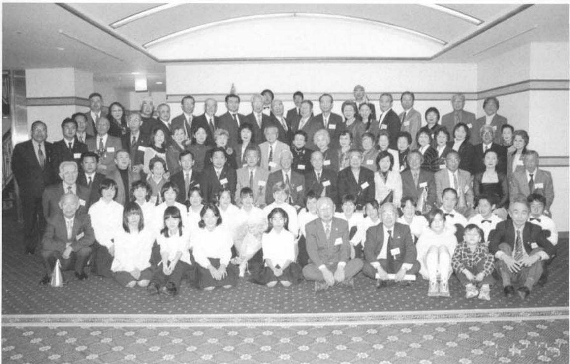
ぐんま日独協会Xマス会 2003・12・7 於：ウェルシティ前橋

〒377-0007 渋川市石原町966 母心堂平形眼科 ☎0279-22-0149 Fax0279-24-6867