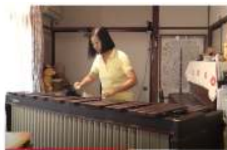
マリンバ解説の動画から