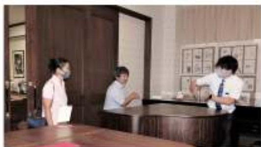
撮影前の打ち合わせ

ところが問題はまだまだあります。苦勞して完成させた動画ですが、Zoomで配信するとスムーズに流れず、参加者側で見ると、せっかくの会長のダンスやマリンバの演奏がぎくしゃくした動きと途切れ途切れの音声になってしまう。10月のピアノの動画は、配信方法を工夫して少し改善されたとはいえ、元の動画の質には遠く及ばず、残念な結果に終わってしまいました。会員のプレゼンテーション用に動画を作成するのはやめて、ライブを中心にするようになりました。(正常な画質の動画はホームページの会員ページ内「趣味創作活動」で視聴できます。まだの方はぜひご覧ください。)