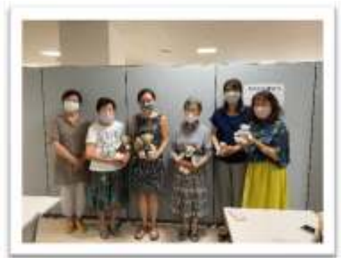
小人数ずつで記念撮影