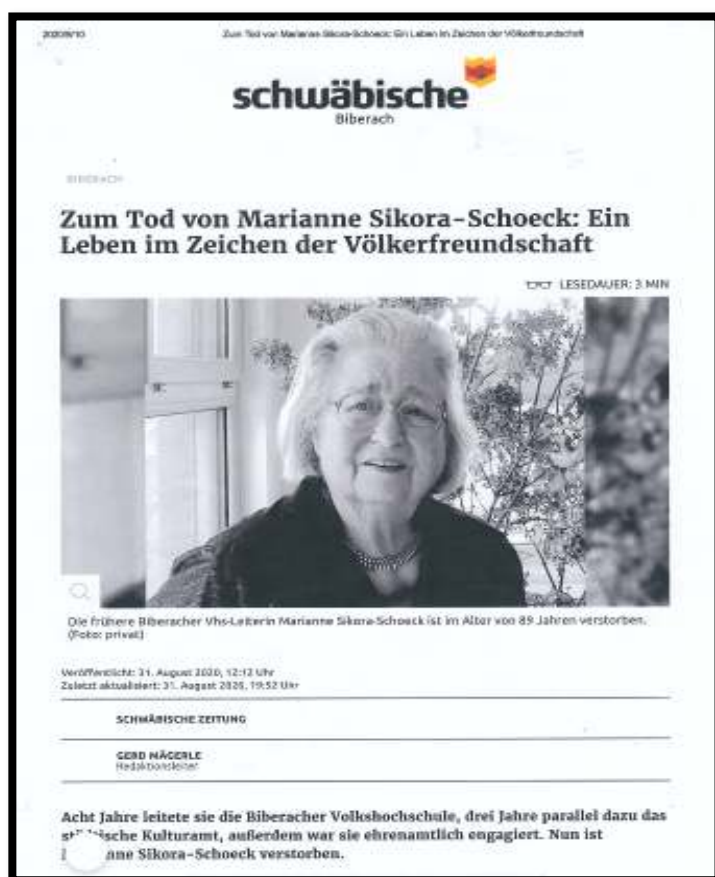
Schwäbische Zeitung (2020.9.10)